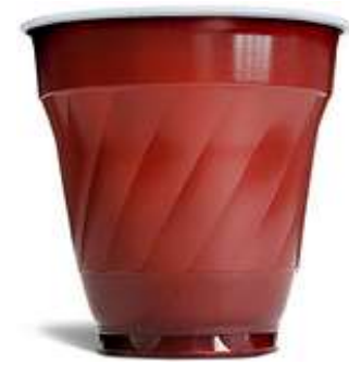
Bicchieri Automatico 166cc

U.M. Ct Pz / Ct 3000 € / Ct € 28,90 Colore Bicolore Peso 3,3gr Iva 22%