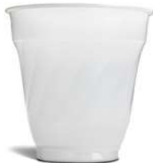
Bicchieri Automatico 166cc

U.M. Ct Pz / Ct 3000 € / Ct € 29,90 Colore Trasluc. Peso 3,3gr Iva 22%