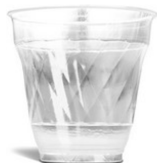
Bicchieri Automatico 166cc

U.M. Ct Pz / Ct 3000 € / Ct € 31,90 Colore Traspar. Peso 3,3gr Iva 22%